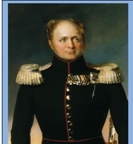
Car Aleksander I Romanow