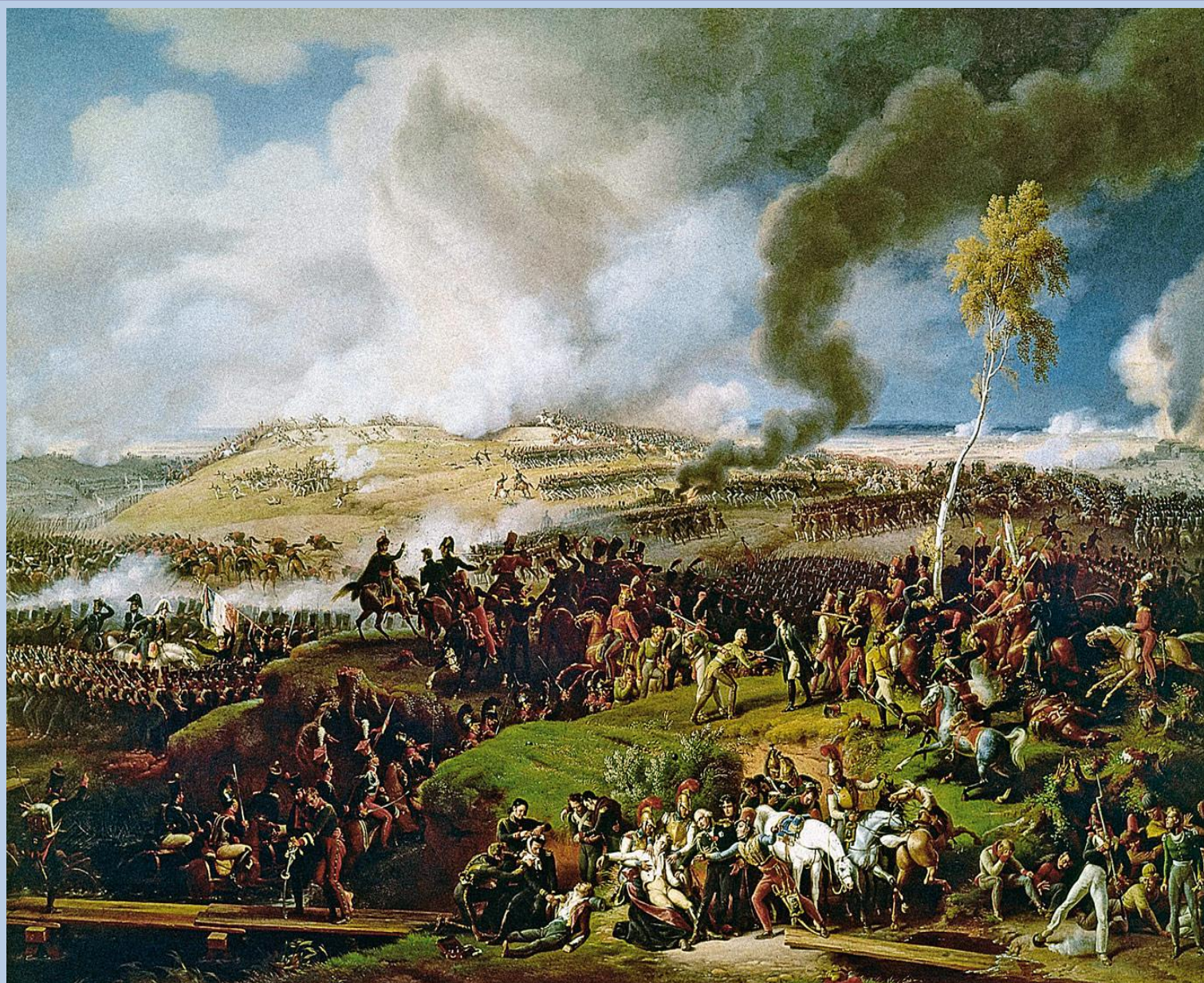
„Bitwa pod Moskwą” czyli pod Borodino według Louisa –Francois Lejeune