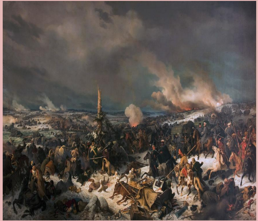
Obraz Petera von Hessa "Bitwa nad Berezyną".

3. Odwrót Wielkiej Armii - bitwa pod Berezyną – niedobitkom Wielkiej Armii udało się przepłynąć przez rzekę