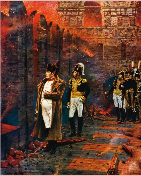
Napoleon na Kremlu Autor Wasilij Wereszczagin